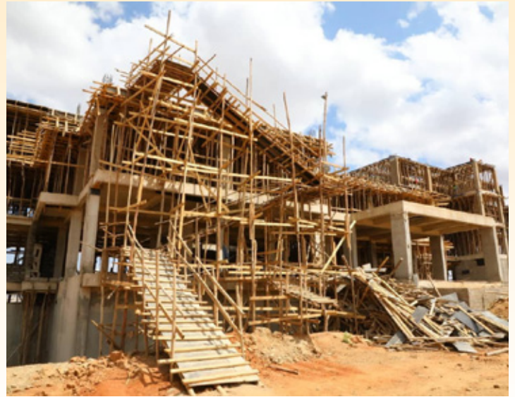
Muonekano wa jengo la ofisi za Wizara ya Nishati (upande wa mbele wa jengo), linalojengwa katika Mji wa Serikali Mtumba, Jijini Dodoma, Agosti 12, 2022.

zaidi ya asilimia 35 na zimebaki asilimia 15 kukamilika.