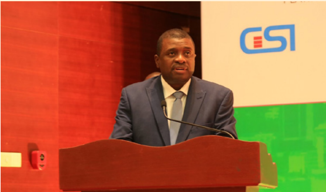
Makamu wa Pili wa Rais wa Serikali ya Mapinduzi Zanzibar, Hemed Suleiman Abdullah akizungumza wakati akifunga Kongamano la Nne la Nishati lililofanyika jijini Dar es salaam kwa siku mbili, Agosti 3 na 4, 2022.

Alisema kuwa, Serikali iko tayari kwa mazungumzo ya uwekezaji kwa kampuni ya aina yeyote ambayo iko tayari kuwekeza Zanzibar katika sekta ya nishati hasa mafuta na gesi kwa maslahi pande zote mbili ambazo ni Serikali na wananchi wake pamoja na muwekezaji husika.