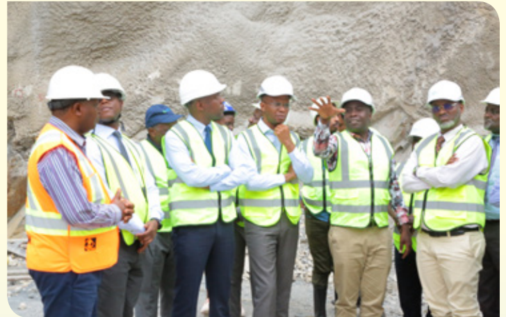
Mawaziri wa Burundi, Rwanda na Tanzania, wakipata maelezo ya maendeleo ya Mradi walipotembelea Mradi wa Umeme wa Rusumo tarehe 20 Agosti, 2022.