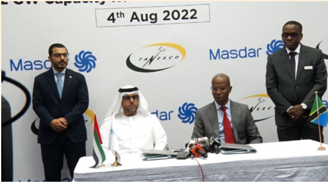
Waziri wa Nishati, January Makamba (wa pili kulia) akizungumza wakati wa hafla ya utiaji saini makubaliano ya kuendeleza Miradi ya Nishati Jadidifu na Kampuni ya Masdar inayomilikiwa na Serikali ya Umoja wa Falme za Kiarabu (U.A.E), Agosti 4, 2022, jijini Dar es salaam.

kwa nchi yetu, kwani wawekezaji walioshiriki katika kongamano hili wamefahamishwa juu ya fursa zilizopo kwa