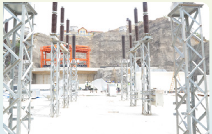
Picha za maeneo mbalimbali ya Mradi pamoja na mitambo itakayotumika kuzalisha umeme kama inavyoonekana pichani.