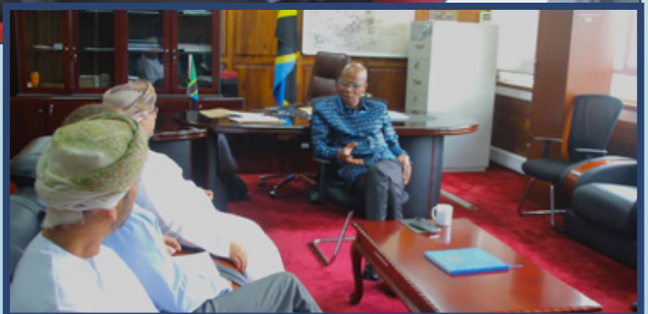
Matukio mbalimbali wakati Waziri wa Nishati Mhe. January Makamba alipokutana na Balozi wa Oman nchini Tanzania Mhe. Saud Hilal Al Shidhani na kuzungumzia fursa mbalimbali za uwekezaji zilizopo katika sekta ya mafuta na gesi.