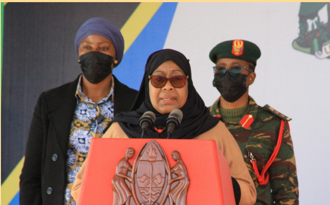
Rais wa Jamhuri ya Muungano wa Tanzania, Mhe. Samia Suluhu Hassan (katika) akizungumza na Wananchi kwenye mkutano wa hadhara katika uwanja wa Sabasaba wakati wa ziara yake Mkoani Njombe, Agosti 10, 2022.