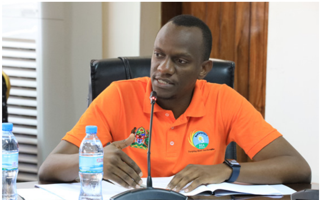
Naibu Waziri wa Nishati, Mhe. Wakili Stephen Byabato akizungumza wakati wa kikao cha Kamati ya Kudumu ya Bunge la Bajeti kujadili Taarifa ya Utekelezaji wa Miradi ya Nishati Vijijini, kilichofanyika bungeni jijini Dodoma, Agosti 30, 2022.